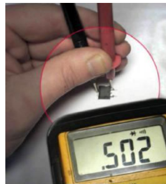
Рис.4. мультиметр показывает падение напряжения на внутреннем диоде - 502 мВ