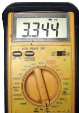
Рис.3. На мультиметре выставляем режим проверки диодов.