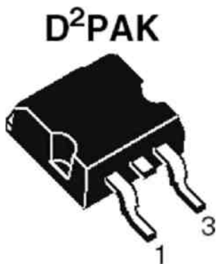
Рис.1. MOSFET N-канальный полевой транзистор.

Таким образом, имея под рукой обычный омметр, можно легко и быстро проверить мощный полевой транзистор.