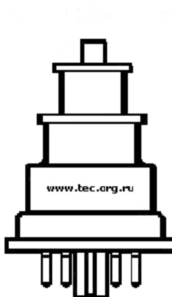
Чертёж триода 6С5Д: